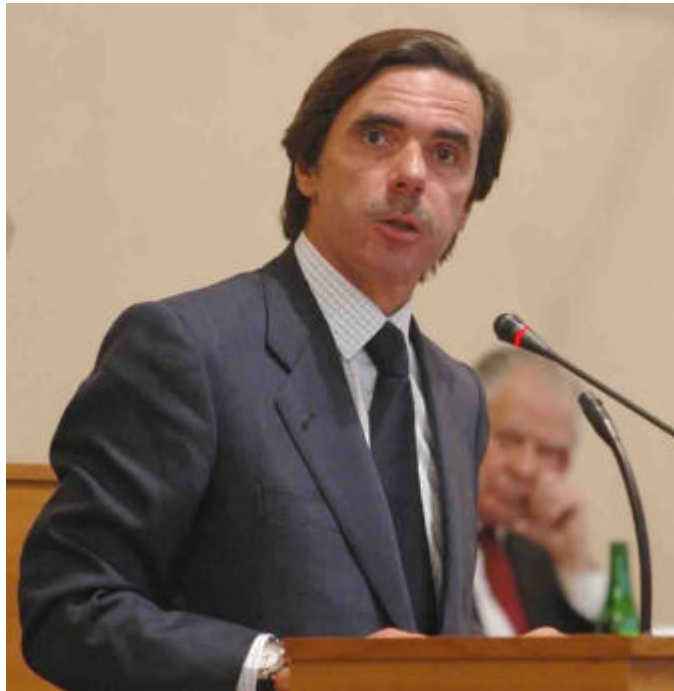
Aznar ha anunciado que entablará un diálogo para lograr el fin de ETA