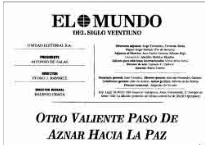
Editorial de El Mundo del 4/11/1998

Ante asunto de tanta trascendencia, los celos partidistas están de más. Si la paz acaba por lograrse, nunca será exclusiva de Aznar: correspon-